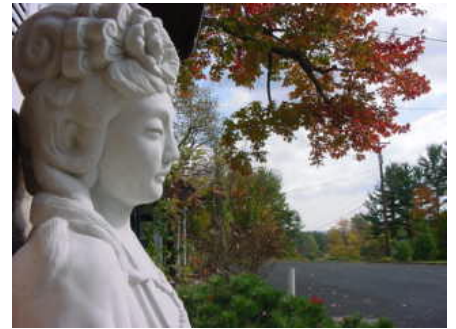
大慈大悲觀世音菩薩