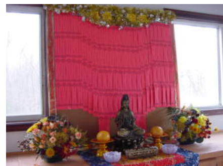
二〇〇四年十一月梁皇寶懺

清淨心的一個方法是，去瞭解我們的心所執著的事物。因爲事物總是在誤導我們的心。如果，我們瞭解我們心所執著的事物，我們的心會更有覺照。佛教教導我們，以正確的方法去瞭解實相和認清事物，則增加我們的貪慾的機會將會減少。如果，我們更加瞭解那些事物，則我們可以轉化我們的心。