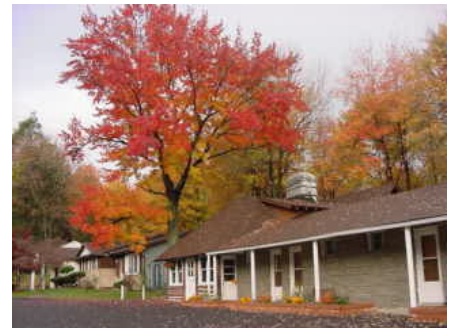
二〇〇四年昆盧寺秋景